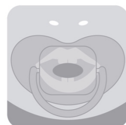
Herkömmlicher Schnuller in Verwendung erschwert Mundschluss